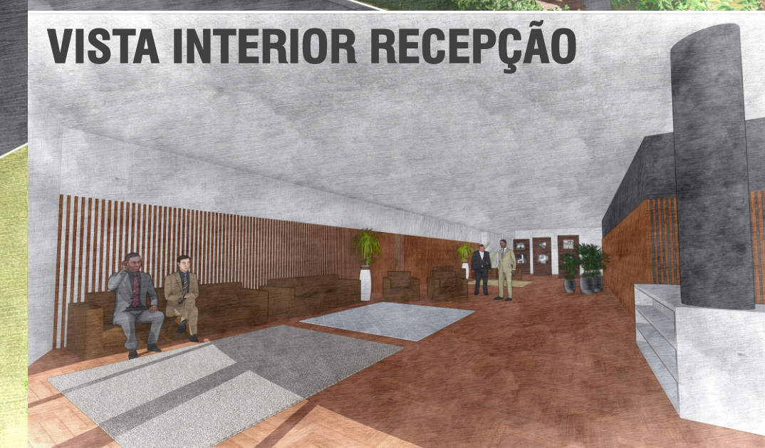
VISTA INTERIOR RECEPÇÃO