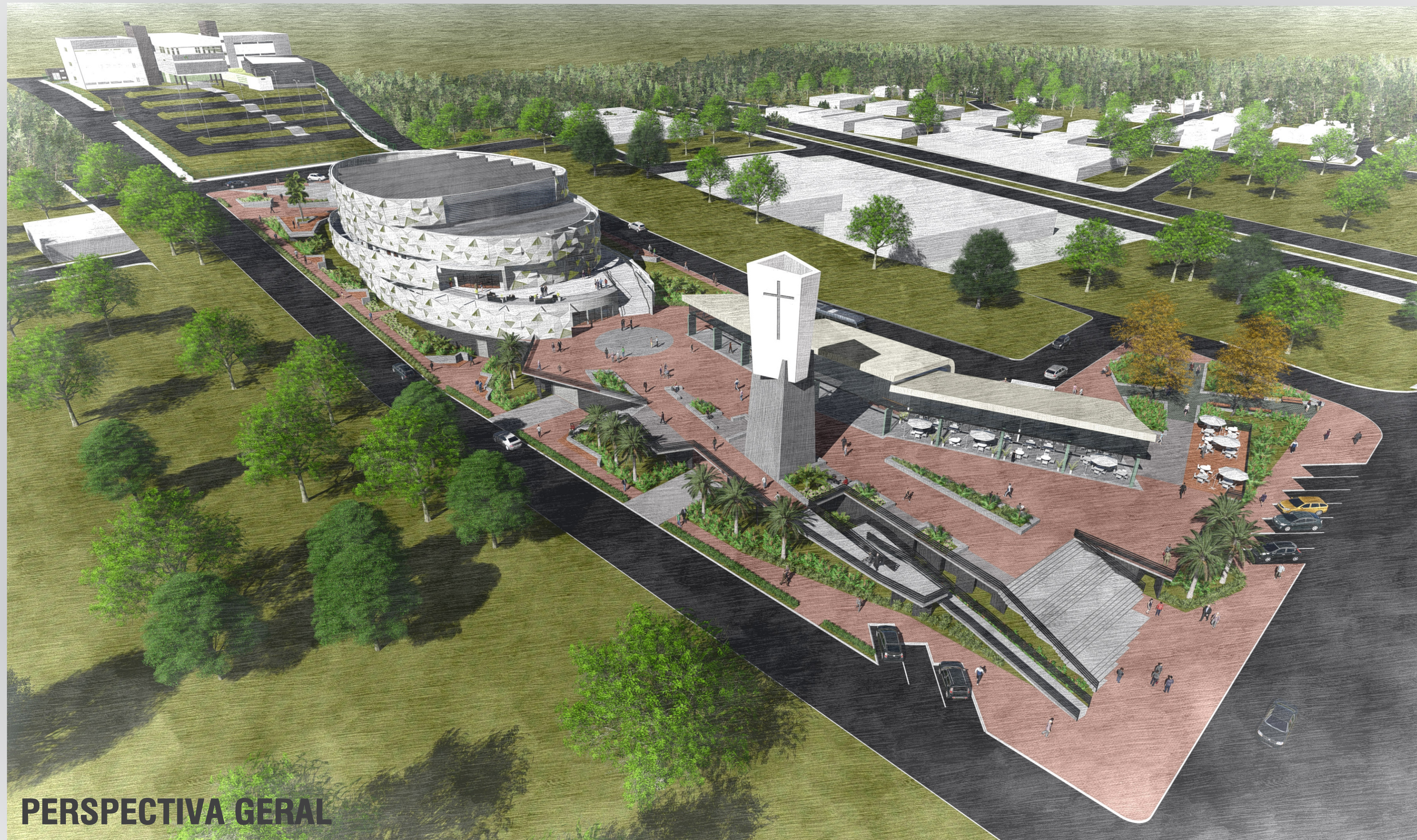
PERSPECTIVA GERAL ACESSO SEGUNDO PAVIMENTO