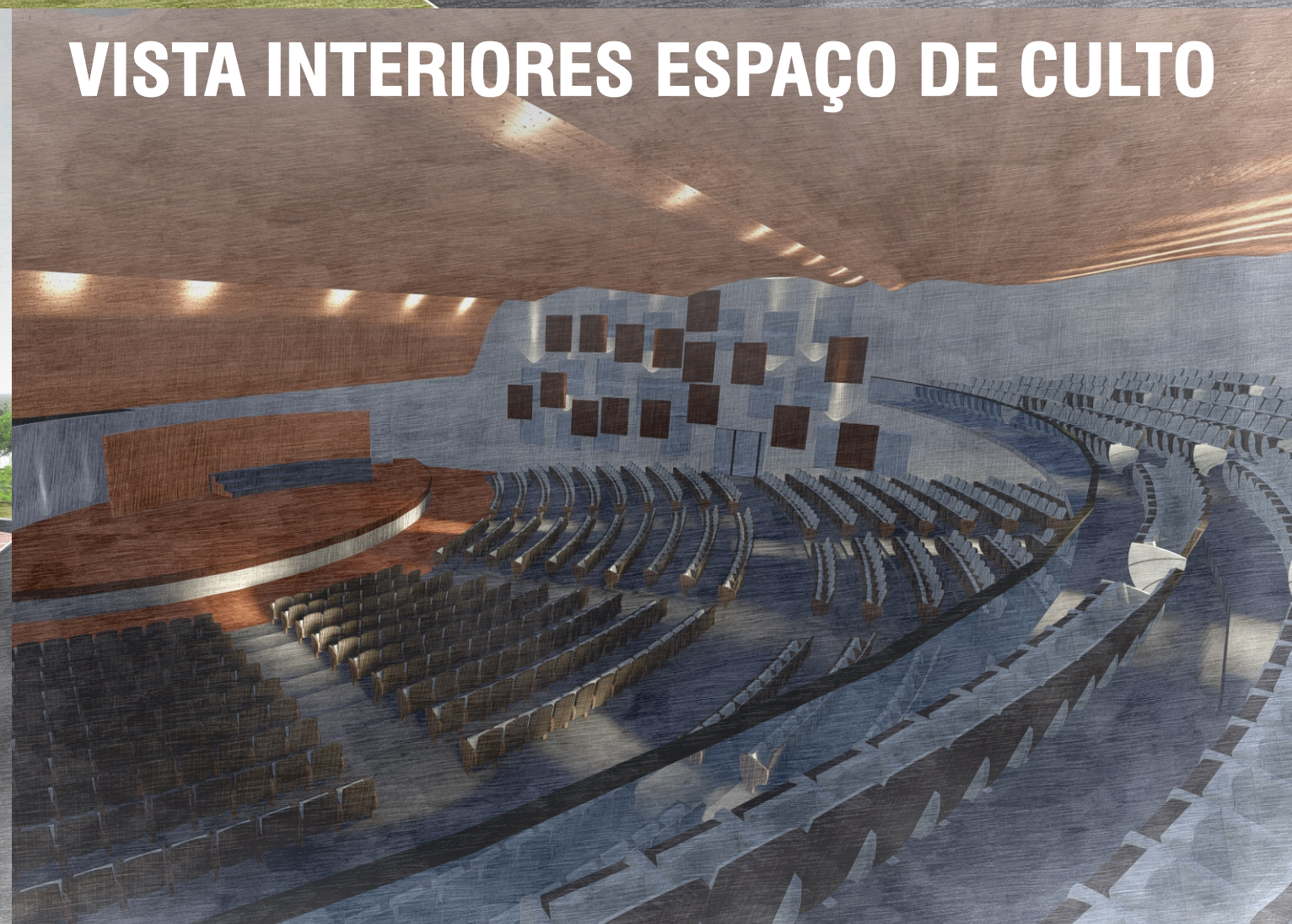
VISTA INTERIORES ESPAÇO DE CULTO